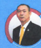
11.00 - 12.00 น. พลิกโฉมเกษตรไทย (Disruptive Change) ด้วยแนวคิด BCG พัฒนาเศรษฐกิจอย่างยั่งยืน

คุณเฉลิมชัย ศรีอ่อน รัฐมนตรีว่าการกระทรวงเกษตร และสหกรณ์