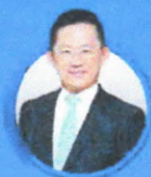
13.30 - 14.30 น. แนวทางอาหาร ภาคเกษตรสู่อนาคต

คุณอาคม เติมพิทยาไพสิฐ รัฐมนตรีว่าการกระทรวงการคลัง