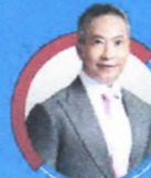
13.30 - 14.30 น. Shaping 5G Industry Transition Towards Digital and Green Energy

Panel Discussion โดย Synnex, Microsoft, Intel, Dell, Huawei และผู้เชี่ยวชาญด้าน Cyber Security