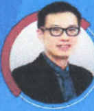
10.00 - 11.00 น. การวิจัยพัฒนาเทคโนโลยีและนวัตกรรม เพื่อสร้างโอกาสและยกระดับ ภาคอุตสาหกรรมไทยเติบโตอย่างยั่งยืน