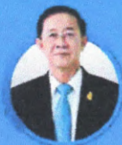
11.00 - 12.00 น. การกระตุ้นเศรษฐกิจประเทศ ด้วยมาตรการการเงิน และการคลัง

คุณอาคม เติมพิทยาไพสิฐ รัฐมนตรีว่าการกระทรวงการคลัง