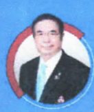
13.30 - 15.00 น. เกษตร-อุตสาหกรรม นำสู่ความยั่งยืน

คุณเฉลิมชัย ศรีอ่อน รัฐมนตรีว่าการกระทรวงเกษตร และสหกรณ์