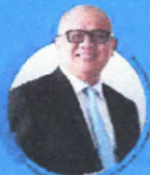
10.00 - 11.00 น. ความท้าทาย COP26 กับ การใช้พลังงานของประเทศไทย

คุณสุพัฒน์พงษ์ พันธ์มีเชาว์ รองนายกฯ สวทช. และ รัฐมนตรีว่าการกระทรวงพลังงาน